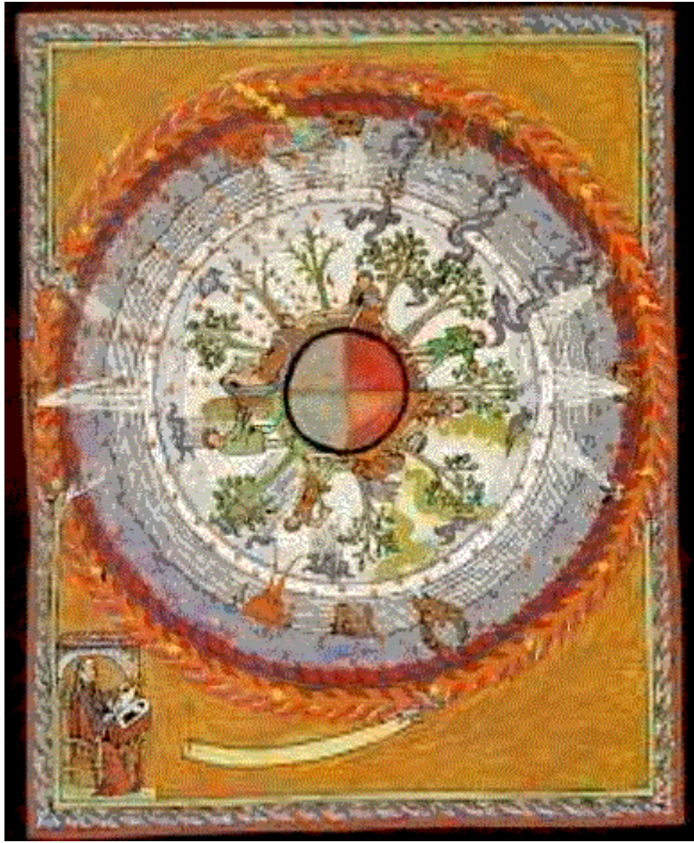
L'arbre cosmique : vision d'Hildegarde Von Bingen