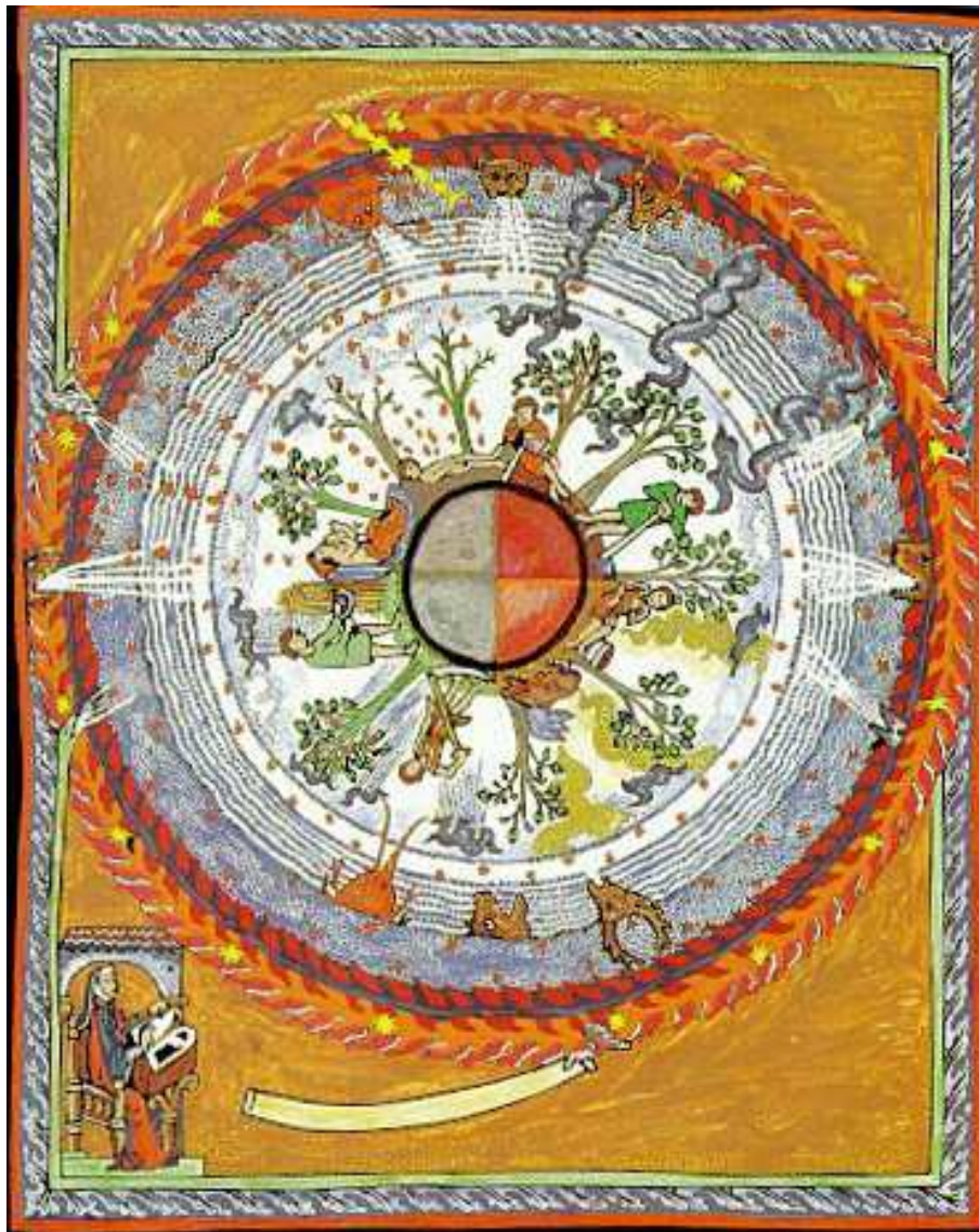
L'arbre cosmique : vision d'Hildegard Von Bingen